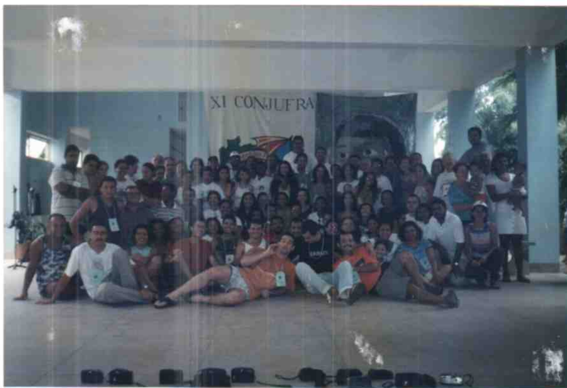
Foto Oficial do XI CONJUFRA