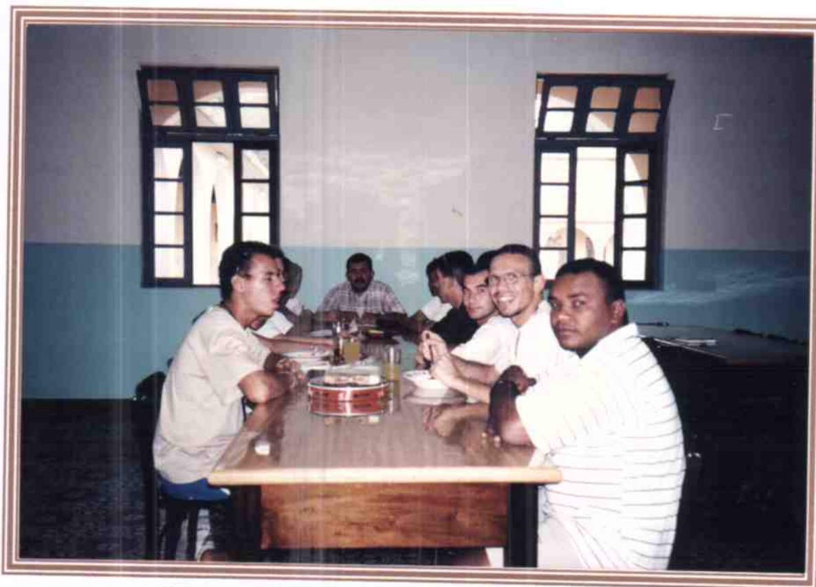
DURANTE O CORJUFRA, FOI FEITA A VISITA DO NACIONAL