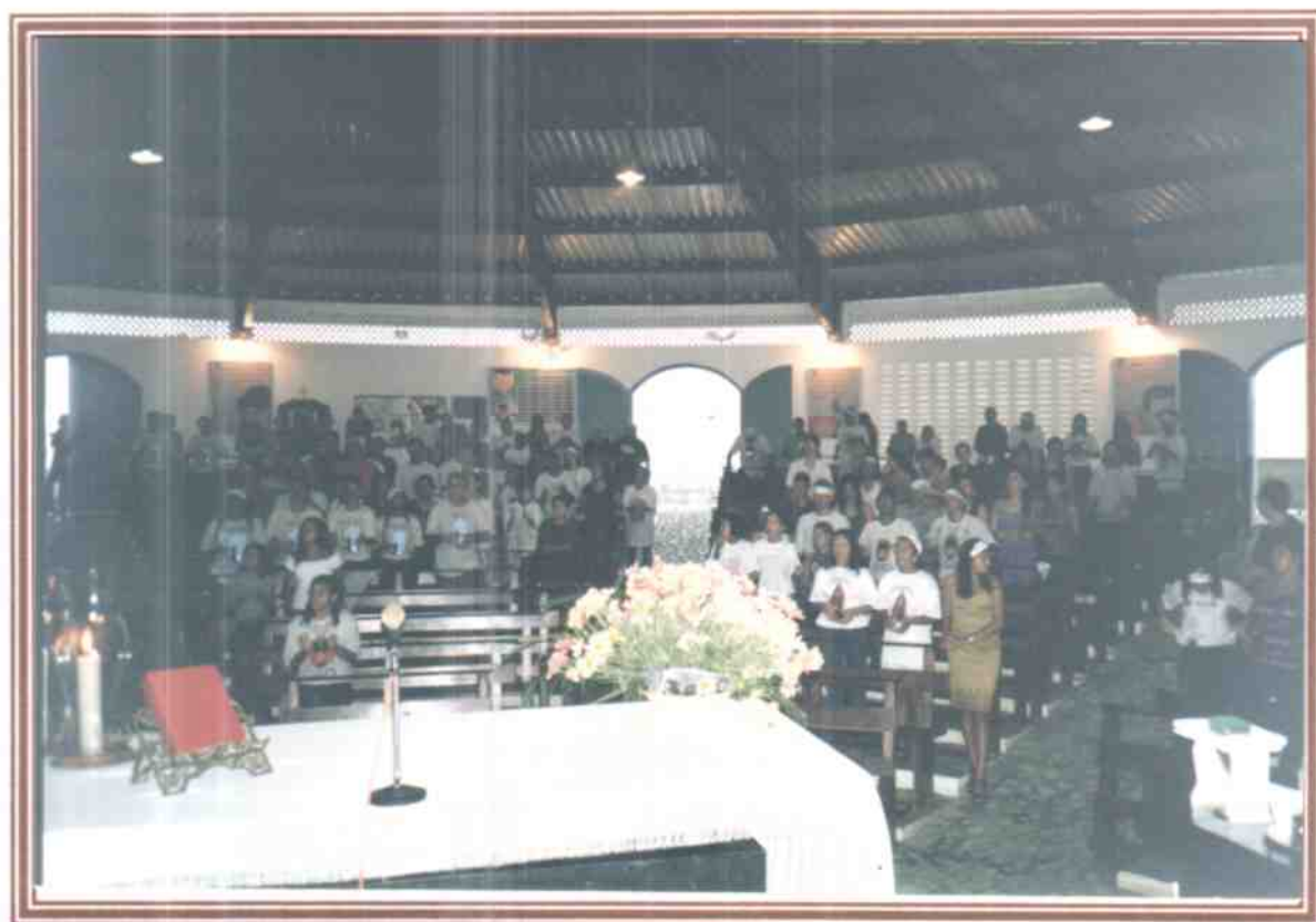
Apresentação Depois de uma longa caminhada até um Santuário da Cidade e muita chuva, todos molhados, participam da Santa Missa com o Pároco.