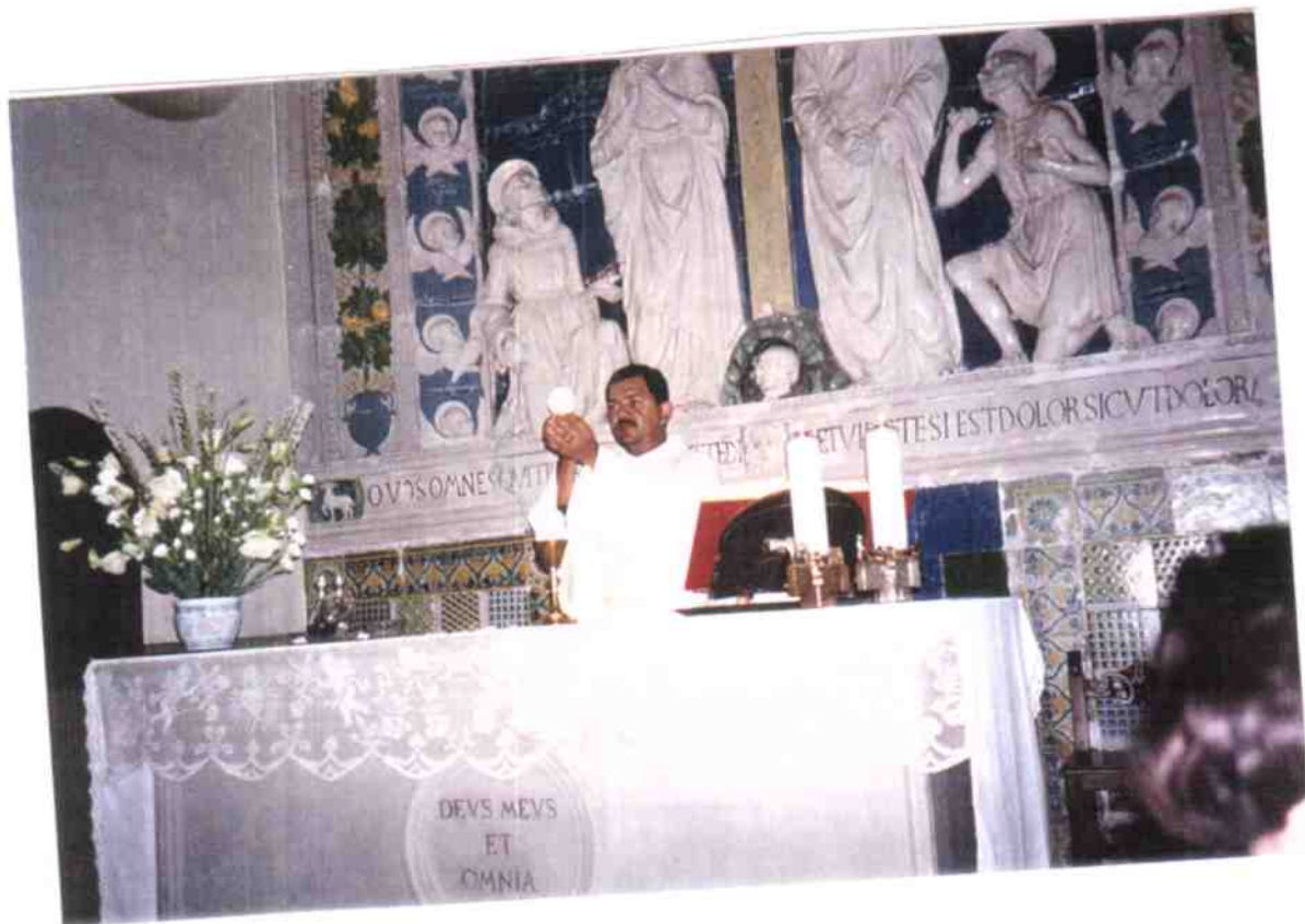
Capela dos estigmas

Celebração Ação de Graças: Pela viagem e pelo encontro