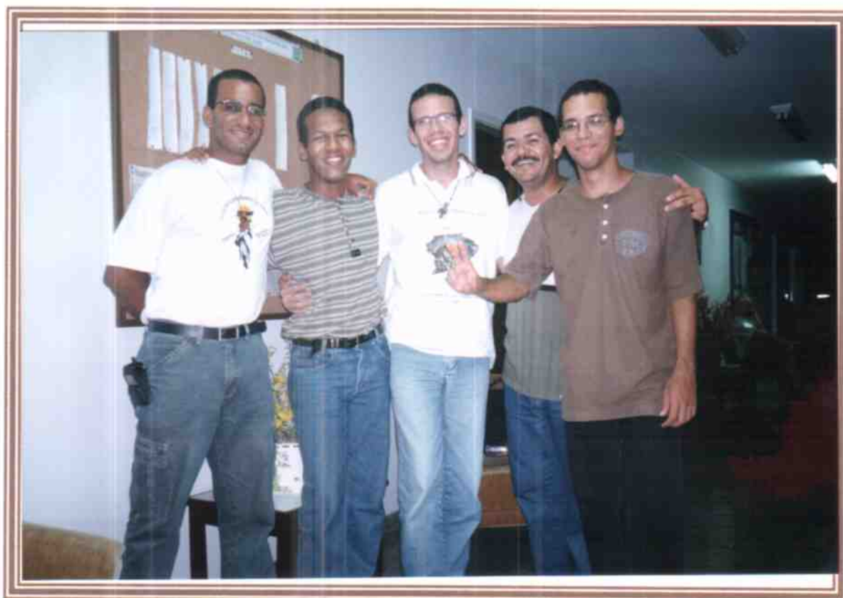
Jufristas do Rio de Janeiro se encontram com os membros do Nacional da Jufra

Rio de Janeiro 09-11 de Março de 2001 - Hospital da Venerável Ordem Terceira (VOT)