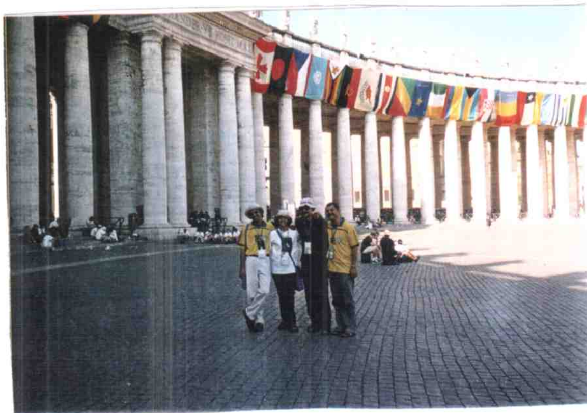
Apresentação da Jufra Brasileira p/ os Jovens Da Jufra do mundo