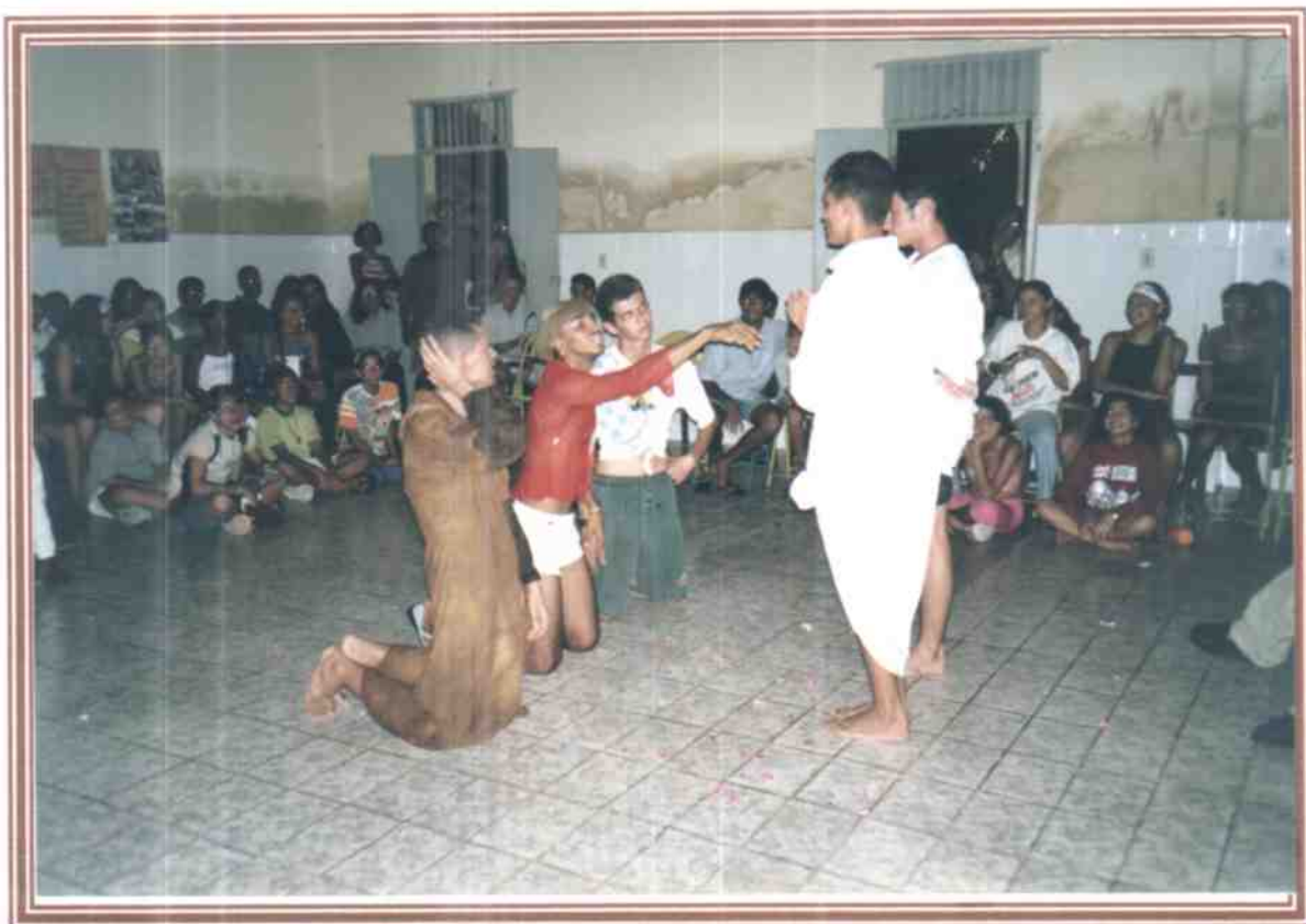
Momento de Cultural: Fraternidade de Pau dos Ferros