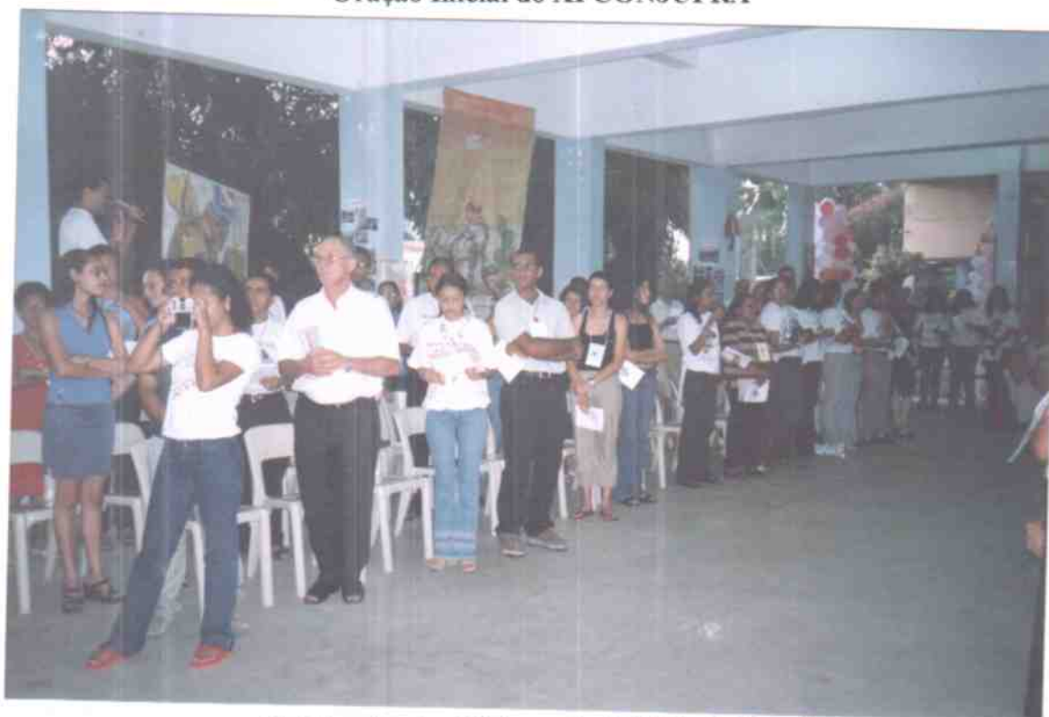
Celebração dos 30 Anos da JUFRA do Brasil