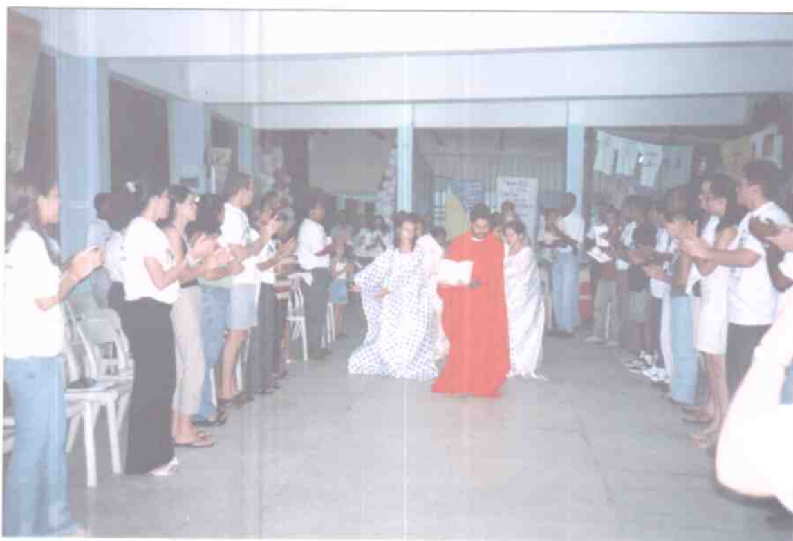
Acolhida da Palavra