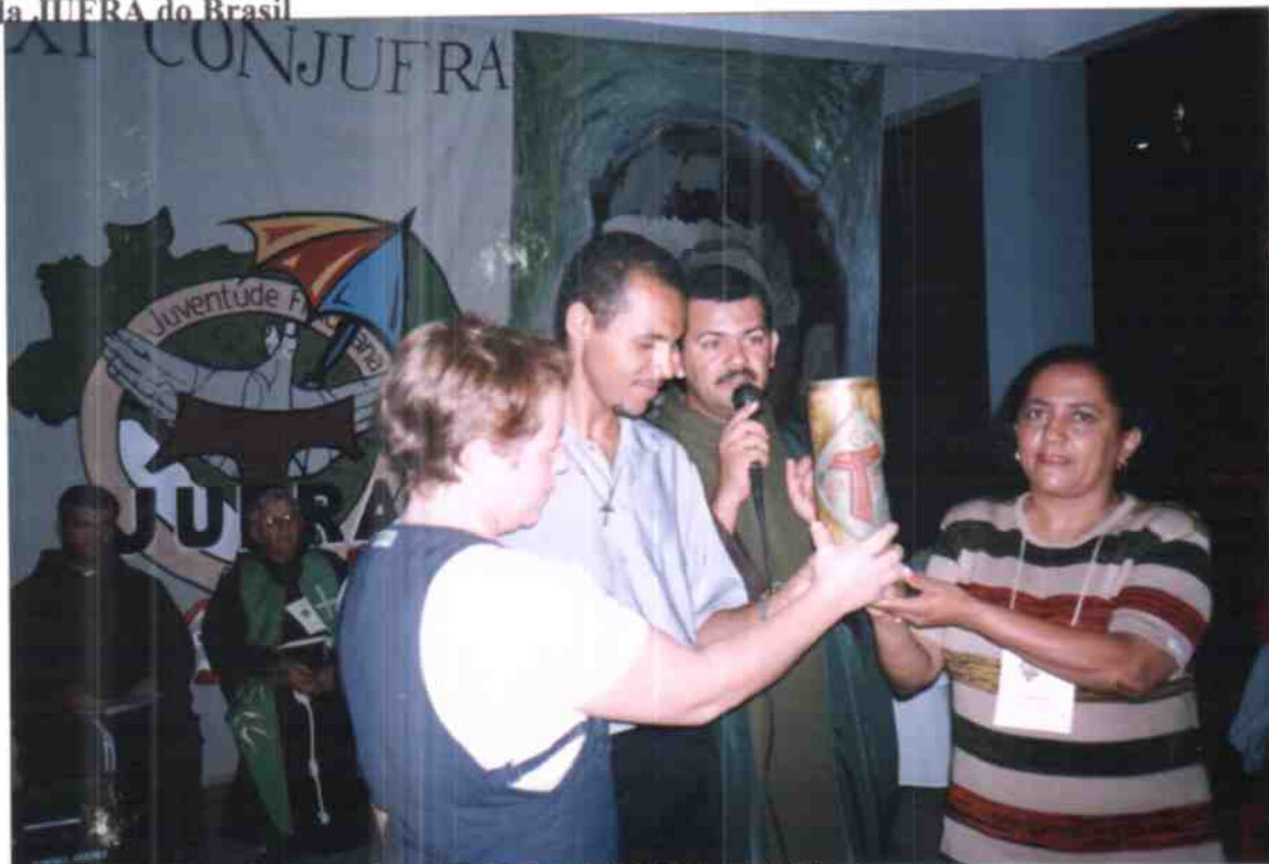
Antigos Secretários(as) Fraternos Reunidos no XI CONJUFRA