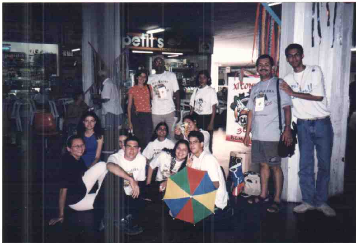
Acolhida do XI CONJUFRA