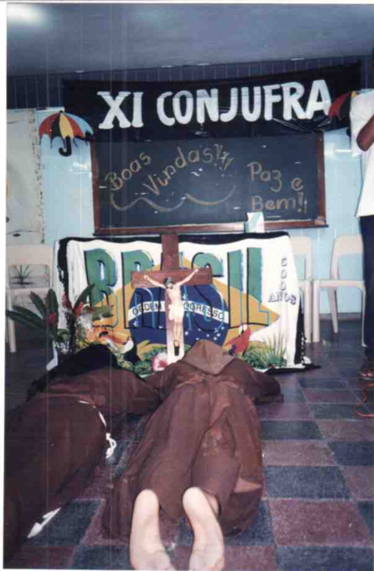
Oração Inicial do XI CONJUFRA