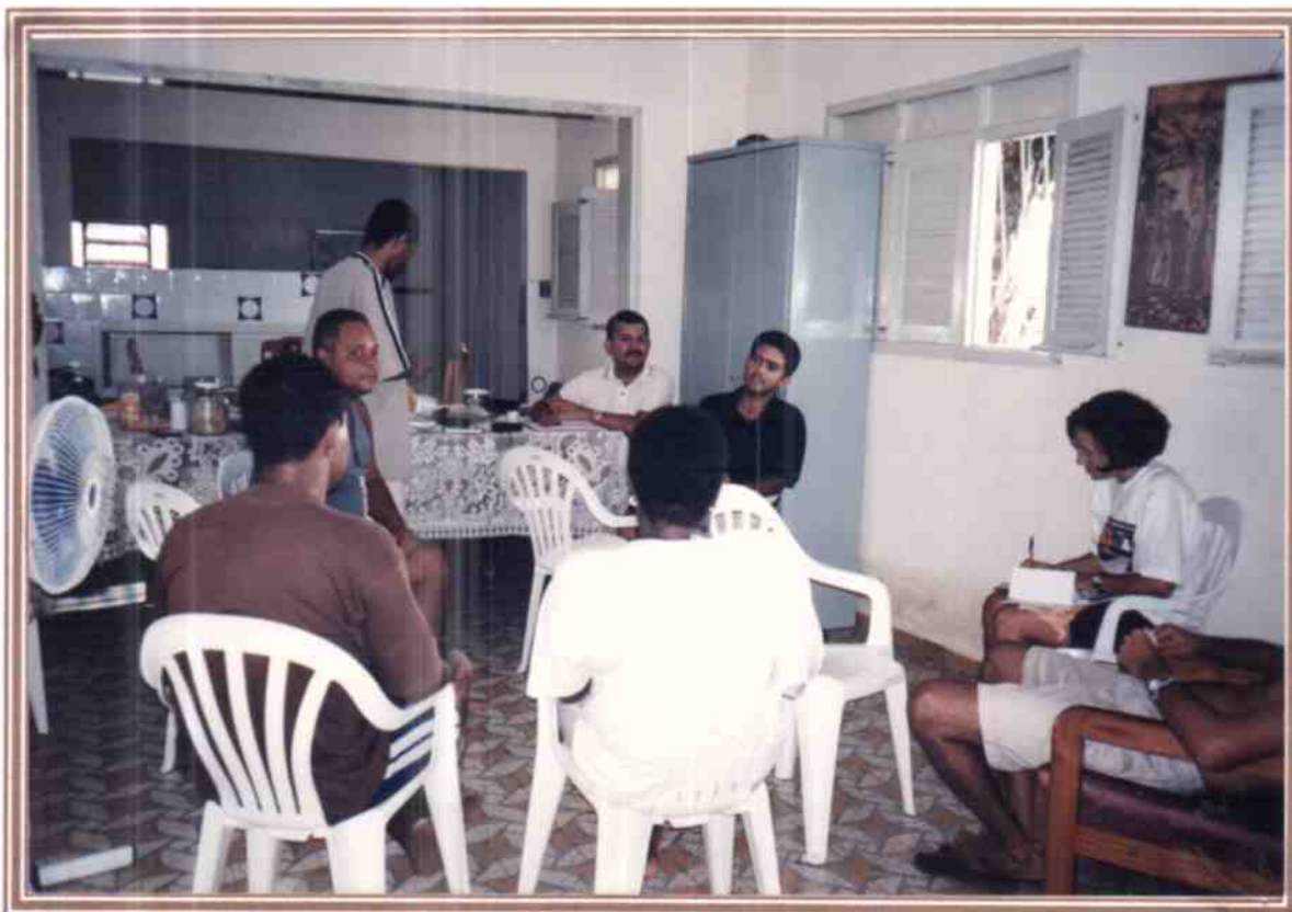
Preparação do XI CONJUFRA - Recife, articular melhor com os regionais sua chegada na capital do Frevo. Fazer os agradecimentos as pessoas que somaram conosco.