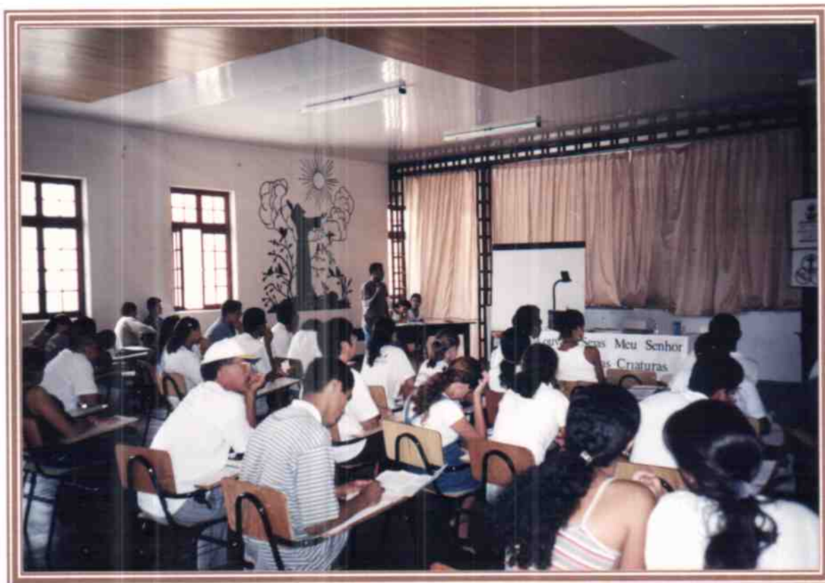
Helmir, acompanha o processo de aprovação do Estatuto Regional