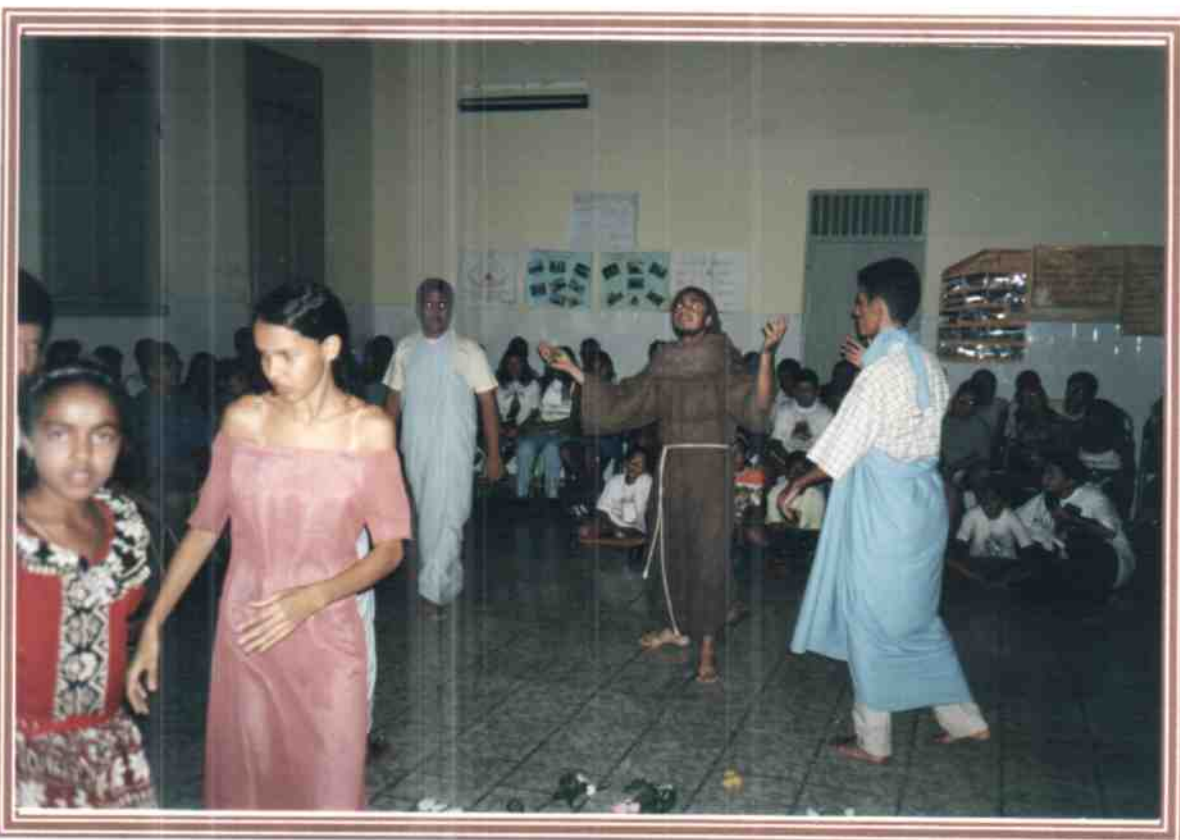
Apresentação dos Mini-Franciscanos da Fraternidade local