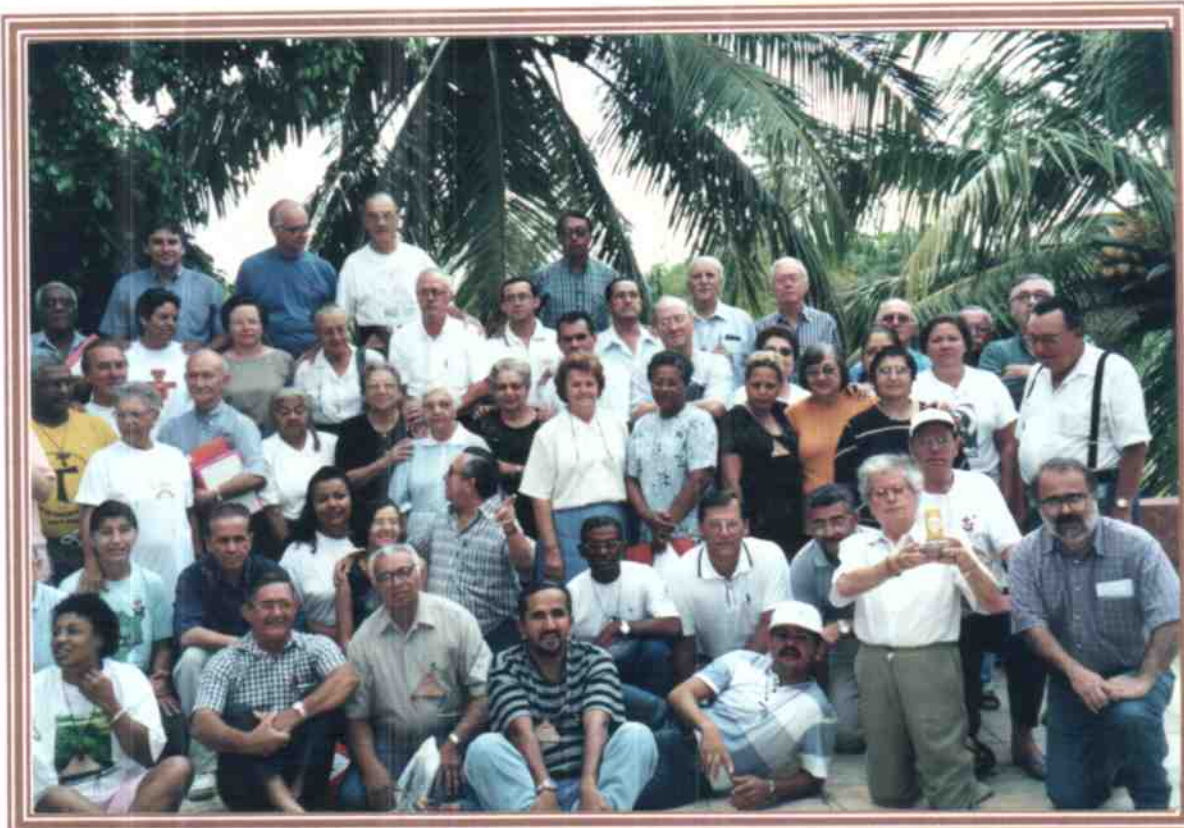
Capitulares reunidos em Foto Oficial