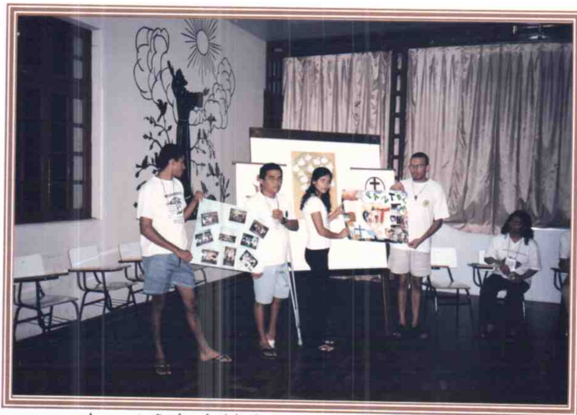
Apresentação do relatório das Fraternidades de maneira dinâmica