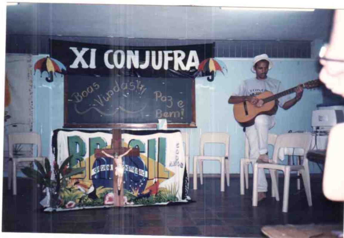
Abertura do XI CONJUFRA