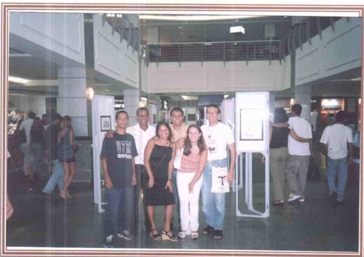
DEPOIS DA REUNIÃO FOMOS CONHECER OUTROS MEMBROS DO REGIONAL