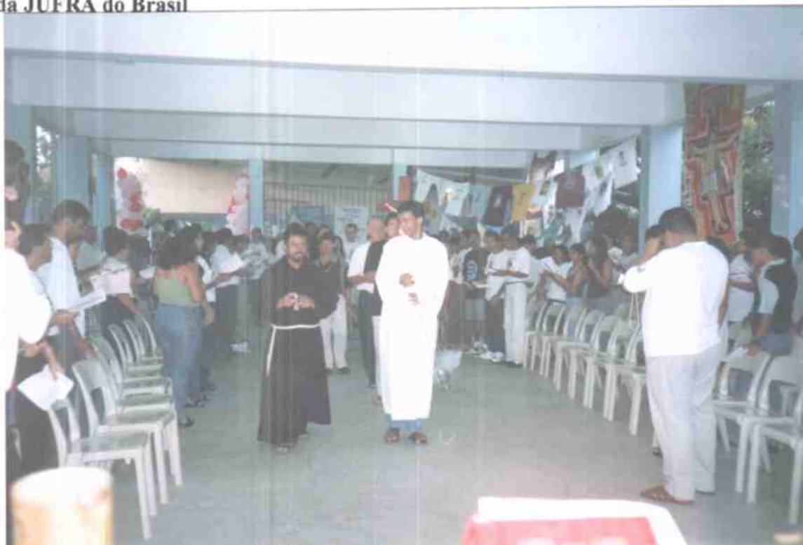
Abertura da celebração dos 30 anos